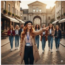
"Le sentier du passé: Guides touristiques dans le centre historique de Vico del Gargano"